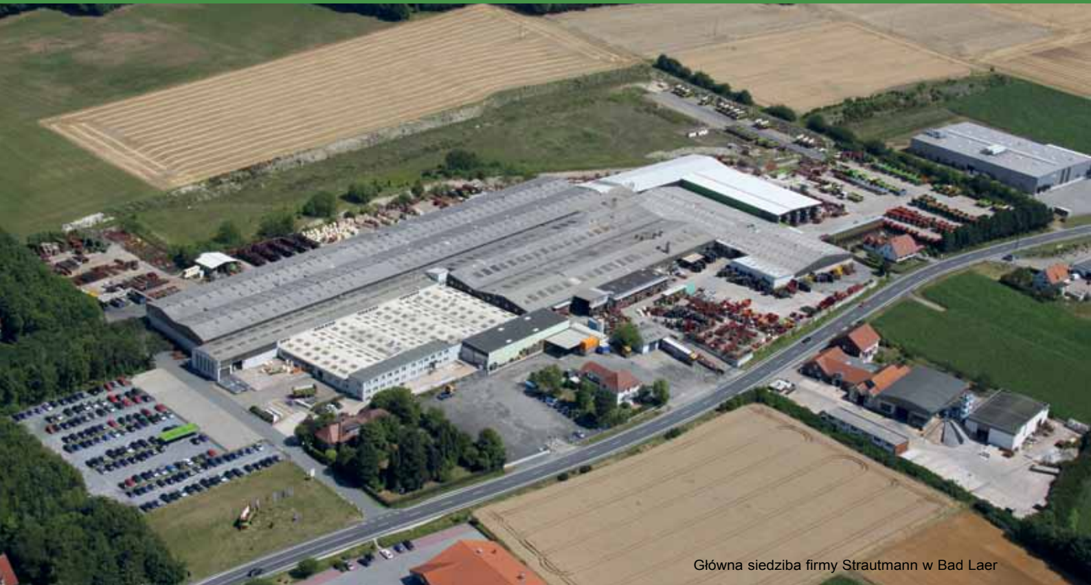
Główna siedziba firmy Strautmann w Bad Laer

Przedsiębiorstwo B. Strautmann & Söhne GmbH u. Co. KG jest rodzinną firmą średniej wielkości istniejąca od ponad 80 lat a mającą swoją siedzibę w południowej części Dolnej Saksonii. Firma Strautmann posiada drugą lokalizację swej produkcji, która znajduje się w Polsce. We Lwówku Wielkopolskim wybudowano nowoczesny zakład, w którym obok poje-